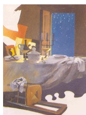
Immagini: Arcabas, Emmaus

È bene scegliere nella casa uno spazio adatto per celebrare e pregare insieme con dignità e raccoglimento. Là dove è possibile, andrebbe creato un piccolo «luogo della preghiera» (cf. CCC, 2691) o anche solo un angolo della casa in cui collocare la Bibbia aperta, l'immagine del crocifisso, una icona della Vergine Maria, un cero, da accendere al momento opportuno.